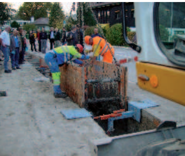
...lors du séminaire à Thielle-Wavre. ...während dem Seminar in Thielle-Wavre.

Au vu des nombreux avantages qu'offre le Système RSS®, il ne fait aucun doute que les Maîtres d'ouvrage le solliciteront beaucoup à l'avenir.