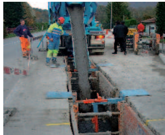
Mise en place du sol fluide... Einbau des Flüssigbodens...