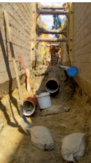
Tranchée selon la méthode RSS® – Sols fluides. RSS® – Flüssigbodengraben.

Après le remblayage de la fouille, le Sol fluide – RSS® – se solidifie (par réactions des additifs), sans qu'aucun compactage ne soit nécessaire. Après solidification, le sol retrouve ses caractéristiques initiales et pourra être excavé à nouveau.