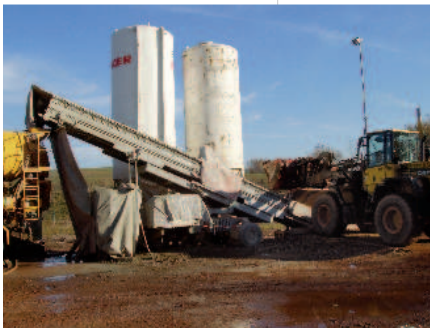
Installation de traitement du sol fluide. Flüssigboden Aufbereitungsanlage.

nisierung, Aktivierung und bei Bedarf Bodenverbesserung mit RSS® -FB- Proviacal) wird das Material mit den Zusätzen RSS® –Flüssigbodencompound und einem Beschleuniger trocken dem Fahrnischer zugeführt. Unter Zugabe von Wasser wird das Bodenmaterial zeitweise verflüssigt. Nach der Verfüllung verfestigt sich der RSS® –Flüssigboden selbstständig (Reaktionen der Zusatzstoffe), d. h., es ist keine mechanische Verdichtung notwendig. Nach der Verfestigung findet der Boden seine geotechnischen Eigenschaften wieder und kann wieder normal ausgehoben werden.