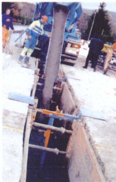
Après le remblayage de la fouille, le sol fluide se solidifie sans qu'aucun compactage ne soit nécessaire.

La révolution dont parle l'ingénieur consiste à combler les fouilles taillées au plus juste dans le sol avec la terre excavée. On l'a dit: cette technique développée en Allemagne est entrée en Suisse par la porte de Neuchâtel. Le bureau d'ingénieur AJS, qui en assume la promotion, a saisi l'occasion qui lui était offerte sur un chantier de Thielle-Wavre pour en démontrer la qualité. Sous les yeux d'une cinquantaine de spécialistes du secteur, des ouvriers du secteur encadrés par deux spécialistes ve-