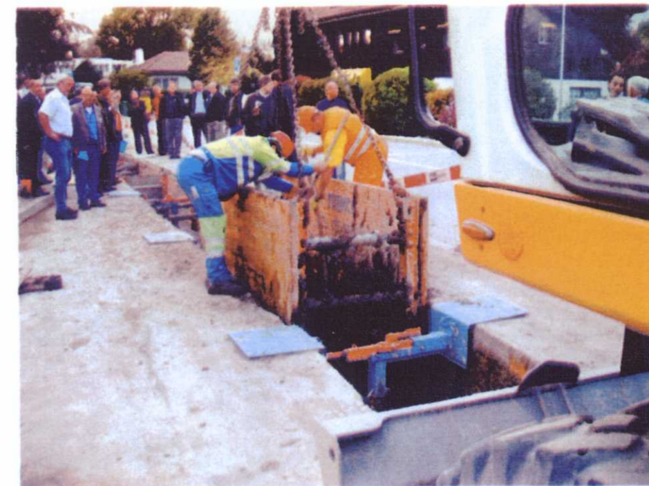
Mise en place du sol fluide sur le chantier de Thielle-Wavre: une démonstration qui en appelle d'autres.

Sur le plan technique, on vient de le voir – le Système RSS-sols-fluides – est une ré-